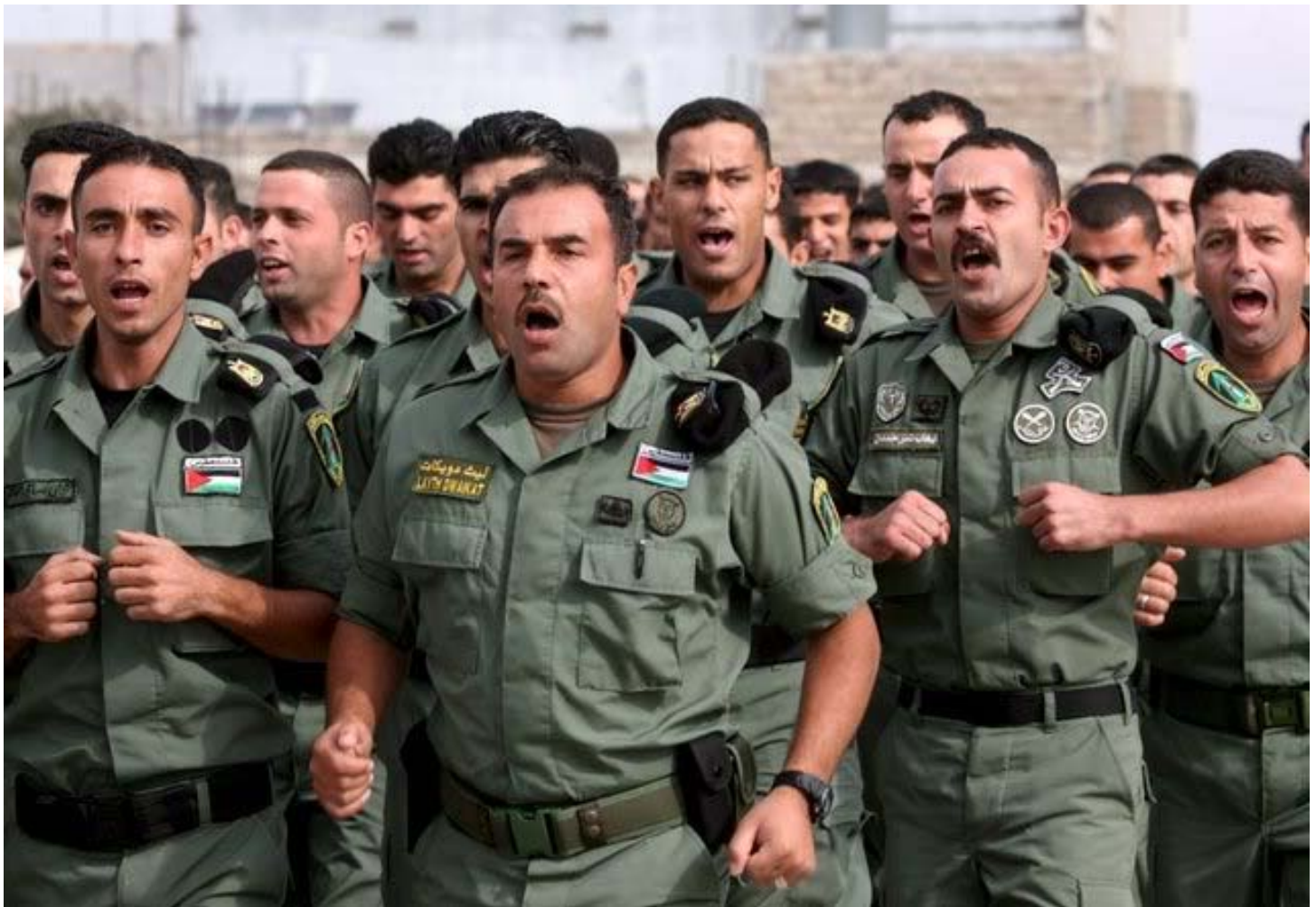
כוחות פלסטינים בתרגיל בחברון, 2008

מאמץ הרש"פ לכונן כוח מזוין – באימון יועצים מן האיחוד האירופי, קנדה וארה"ב